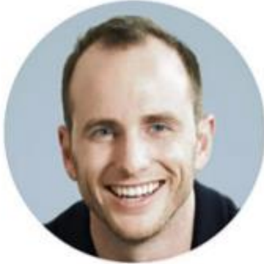
Joe Gebbia PR و رابط کاربری

دارای دو BFA در طراحی گرافیکی و طراحی صنعتی از مدرسه طراحی Rhode Island