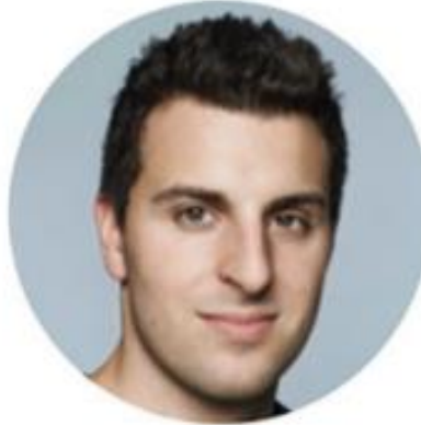
Brain Chesky توسعه کسب و کار و برند

دارای دو BFA در طراحی گرافیکی و طراحی صنعتی از مدرسه طراحی Rhode Island